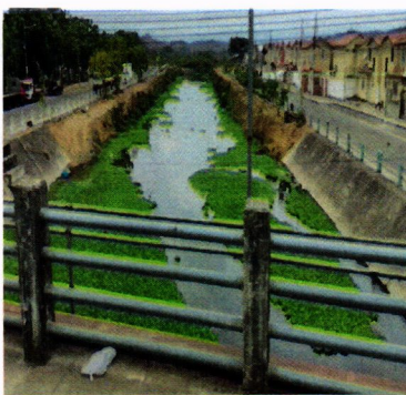
Canal 44 D1