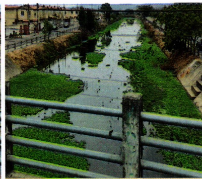
Canal 44 D

En la inspección se observa las condiciones del canal fotos 1-2-3